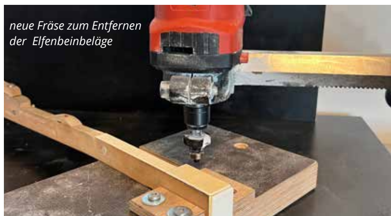
neue Fräse zum Entfernen der Elfenbeinbeläge